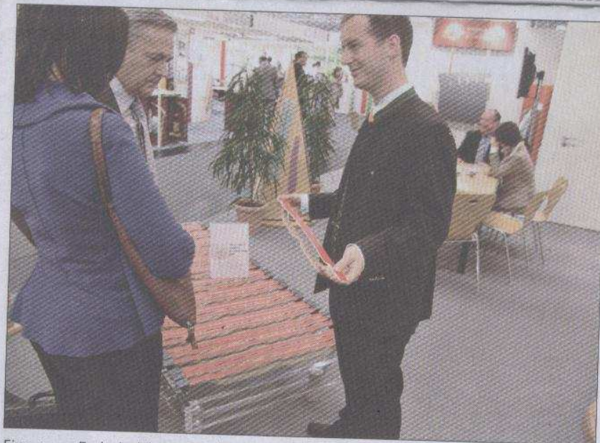
Eine neue Federholzleiste präsentierte die Sperrholzwerk Schweitzer GmbH aus St. Marienkirchen (Österreich) auf der Messe in Köln. Die mit dem „Interzum award“ für hohe Produktqualität ausgezeichnete Doppellamelle „Durosoft“ besteht aus einer dünneren weichen und einer dickeren Unterlamelle als tragendes Element. Die Lamellen werden in einem Arbeitsgang miteinander verpresst. Dadurch erhält die Oberlamelle eine Vorspannung.

Döttingen (Schweiz) sind es die hochwertigen Skikerne aus Holz. Trotz der zuletzt bescheidenen Winter in Europa habe man gute Geschäfte gemacht in diesem Bereich, heißt es bei den Schweizern. Gelitten hätten vor allem die Anbieter preiswerter Modelle mit Schaumkern. Bei der TS Teutoburger Sperrholz GmbH aus Detmold sind es derzeit vor allem die Schubkästen aus Buchensperrholz. TS stellte im Gegensatz zu den anderen Mitbewerbern nicht in Halle 5.2 sondern in Halle 5.1 aus und war in diesem Jahr auch schon bei der „ZOW“ in Bad Salzuflen vertreten.